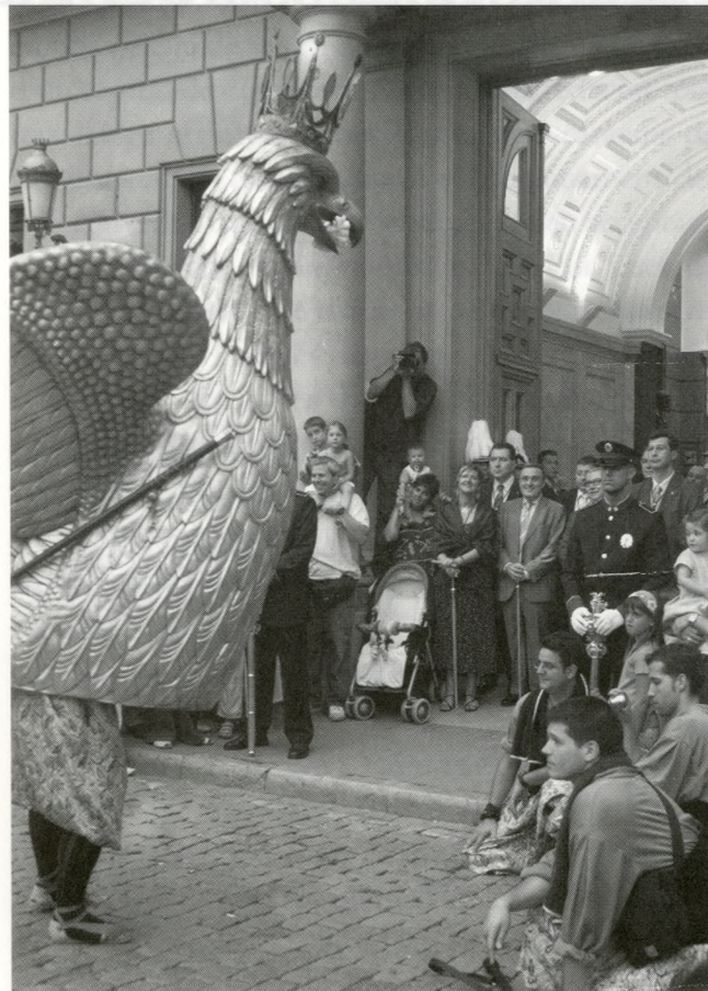
L'àliga saludant al consistori a l'anada a completes.

de octubre de 1733, con el especioso motivo de haberse dignado N. SS. Padre Clemente XII conceder la extensión del rezo propio del gloriosísimo San Bernardo Calvó... Barcelona: Impremta de Marià Martí, 1735, p. 104.