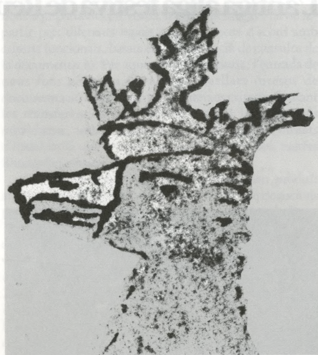
Àliga coronada, segons un dibuix reusenc dels segles XIV-XV. (AHMR).

menor continuïtat, en altres anys. Sembla factible creure que s'intenta mantenir-la dins el seguici, però que la necessitat de comptar amb un ballador especialitzat i el deteriorament de la peça, que necessitaria ser reparada força més sovint que els gegants, motiven les interrupcions.