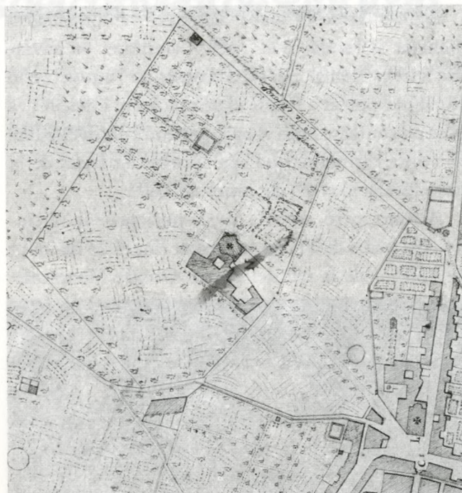
Planta i solar del convent de Sant Joan el 1750. També s'hi pot veure el convent carmelità femení que hi hagué a l'actual plaça de Prim..

Les condicions inicials a Sant Roc devien ser precàries a jutjar per una nota del Consell datada el 29 de març: