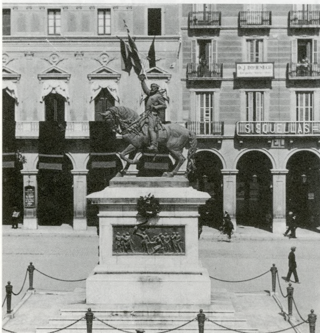
Estàtua del General Prim els primers dies de la República.

Fa setanta-cinc anys, unes eleccions municipals, que foren tot un plesbicit a favor de la república, comportaren la caiguda de la monarquia i, si més no inicialment, la proclamació de la República Catalana.