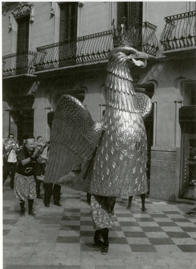
L'Àliga de Reus, en l'actualitat. (foto: S. Palomar).

Enguany fa deu anys de la reincorporació de l'àliga al seguici de la festa major reusenca. Tot i que el seu simbolisme històric, la cronologia de la seva presència a les celebracions dels segles XVII i XVIII, i la seva funció en la festa van ser objecte d'estudi en el moment de la seva recuperació, 1 l'anàlisi de la documentació conservada a l'Arxiu Municipal possibilita encara una aproximació més acurada a la trajectòria d'un element d'imatgeria popular que, durant poc més