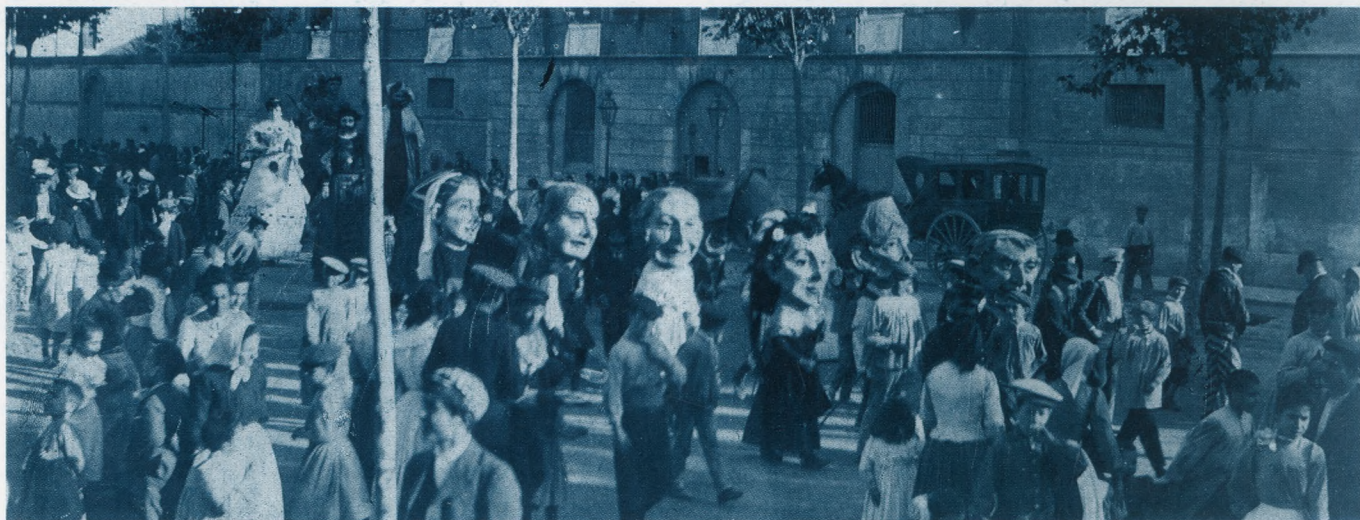
Gegants i nanos al tombant de 1900 (AMR).

Enguany fa 400 anys de la construcció del convent de Sant Joan, un fet que suposaria l'inici de la urbanització d'un sector de la vila, fora la muralla medieval. L'activitat vol servir per conèixer aquest moment de la història de Reus: els conflictes amb el franciscans per l'edificació del nou convent, el paper del municipi, l'esclat festiu de començaments del segle XVII o l'expansió urbanística a partir del que avui és el carrer de Sant Joan.