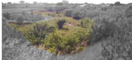
Vista 1. Barranc del Pedret