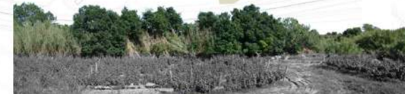
Vista 6. Vegetació de ribera del barranc de l'Escorial.