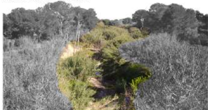
Vista 2. Barranc del Pedret