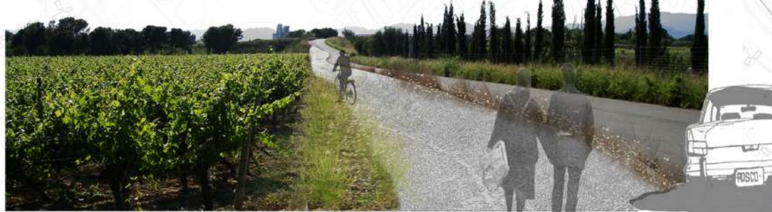
Marge de la carretera paral·lela a la T-11 Nous recorreguts paisatgístics