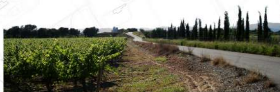
Vista 7. Carretera paral·lela a la T-11 Visuals de les muntanyes al fons i les fileres arbòries del primer pla visual estructurants de la percepció del paisatge.

Control de l'erosió existent en els marges dels barrancs