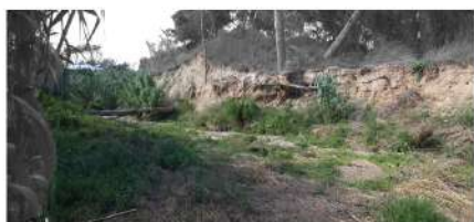
Vista 3. Barranc del Pedret