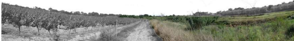
Vista 5. Límit entre el cultiu de la vinya i el barranc del Pedret. També es veu l'encreuament del barranc del Pedret i de l'Escorial al fons.