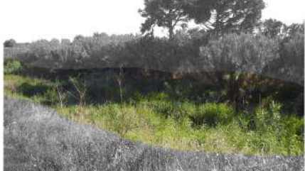
Vista 4. Barranc del Pedret